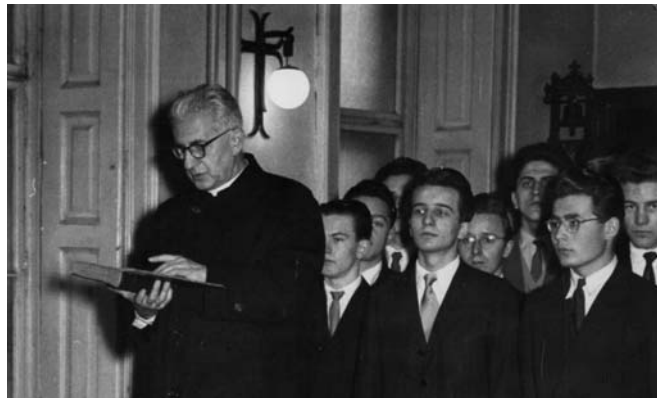
Diákokkal a budapesti piarista kápolnában, 1959.

Ez a „égi és földi szeretet” volt talán a legfontosabb jellemzője Sík Sándor egyéniségének, életének. Szent Pál módjára törekedett arra, hogy élő hitével egyre jobban gyökeret verjen a szeretetben. Isten iránti szeretete