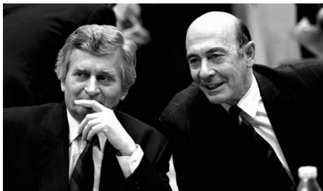
A brüsszeli NATO-központban (1991)

az, aki gondoskodik az osztály tagjairól, ismeri őket, és nem ellenük dolgozik, hanem az ő ügyükben dolgozik. Antall Józsefnek ilyen volt az egyénisége, és ezt az egyéniséget megőrizte nagy méretekben is, amikor miniszterelnök volt.